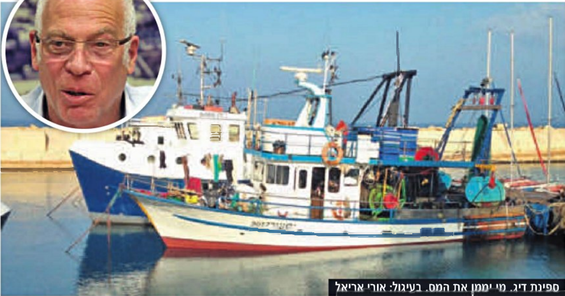
ספינת דיג. מי יממן את המס. בעיגול: אורי אריאל

שר החקלאות מיהר לקחת קרדיט על ההסכם למניעת דיג בספינות מכמורת - אך משרדו מסרב להשתתף במימון ומעכב את הוצאתו לפועל