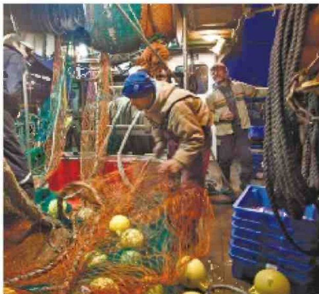
תיקון רשתות בסירת דיג

רוטשילד סבור כי יישום הריפורמה יגדיל את השלל השנתי מ-3,000 טונה כיום ל-5,000 טונה בעוד 20 שנה, דבר שיאפשר להגדיל את מספר המתפרנסים מהדיג בכ-40% וישפר את הסביבה הימית. ללא הרפורמה צפוי השלל לרדת לכ-1,500 טונה בשנה בתוך 20 שנה, מצב שיובייל לצמצום העוסי קים בדיג בכ-40% ולפגיעה סביבי